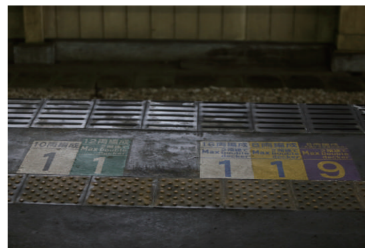
「新幹線今昔物語～北海道新幹線開業に寄せて～」 出展作品