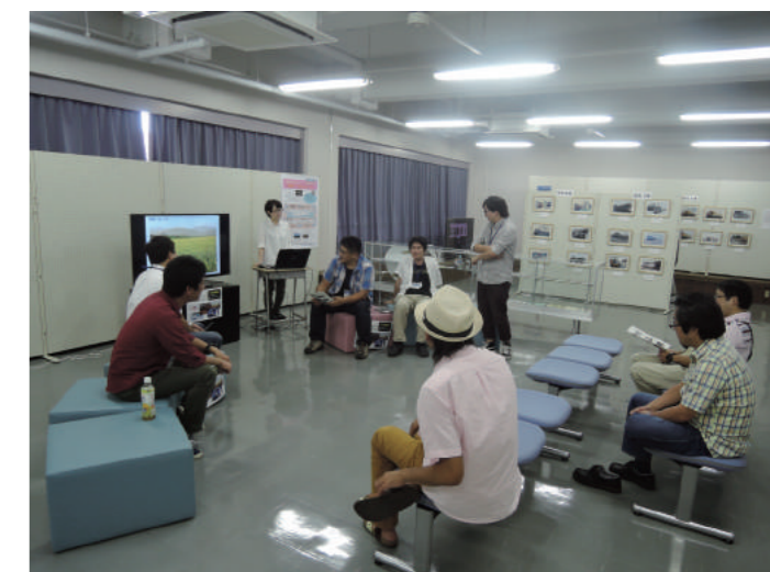
発表当日の会場風景 (平成27年度)