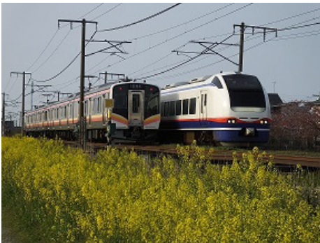
平成30年度応募作品