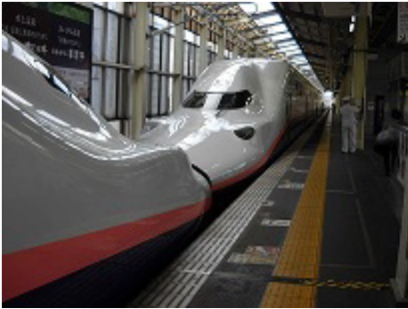
平成30年度応募作品