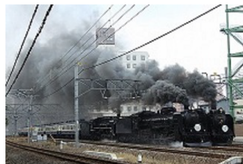
令和元年度応募作品