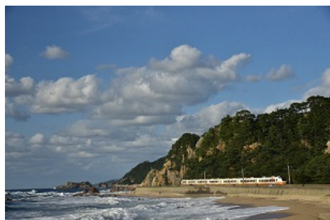
令和元年度応募作品