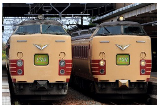
令和元年度応募作品