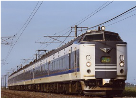
令和3年度応募作品