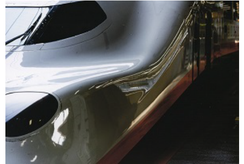
令和3年度応募作品